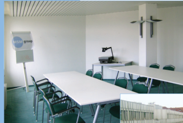
Im Schulungs- und Konferenzraum des MSM Office Business Center haben Sie nicht nur eine schöne Aussicht ins Grüne, sondern können mit bis zu 40 Personen Schulung oder eine Konferenz abhalten