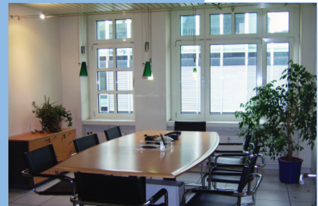
Unser modern ausgerüstetes Sitzungszimmer steht ebenfalls zur Verfügung