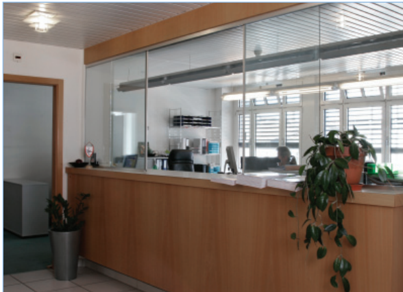
Grosszügiger Eingang mit Schalter, Sekretariat und umfangreicher Infrastruktur