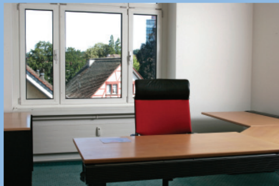
Günstiger, voll ausgerüsteter Arbeitsplatz im Grossraumbüro