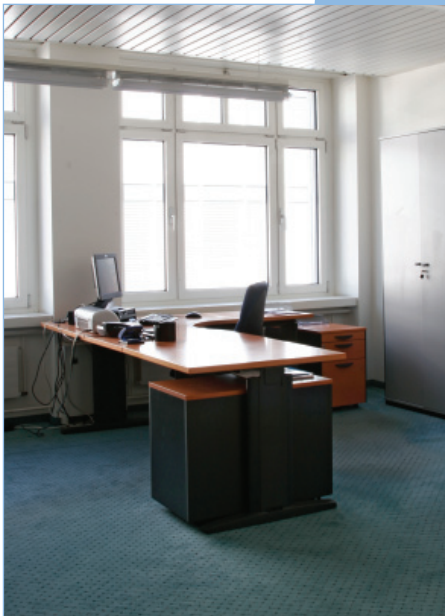
Das Einzelbüro, Ihre eigene Welt im MSM Office Business Center