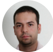
Murat Cay Administration

Alle Arbeitsplätze im MSM Office Business Center umfassen Internet- und Tel.- Anschluss, LAN, Mitbenutzen von Küche, WC, Sitzungszimmer, Schulungsraum, Reinigung, Entsorgung. Basis-Sekretariatspaket mit Kundenempfang und Telefonservice.